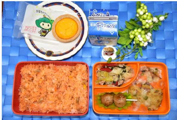
ハロウィンランチ (R5.10)