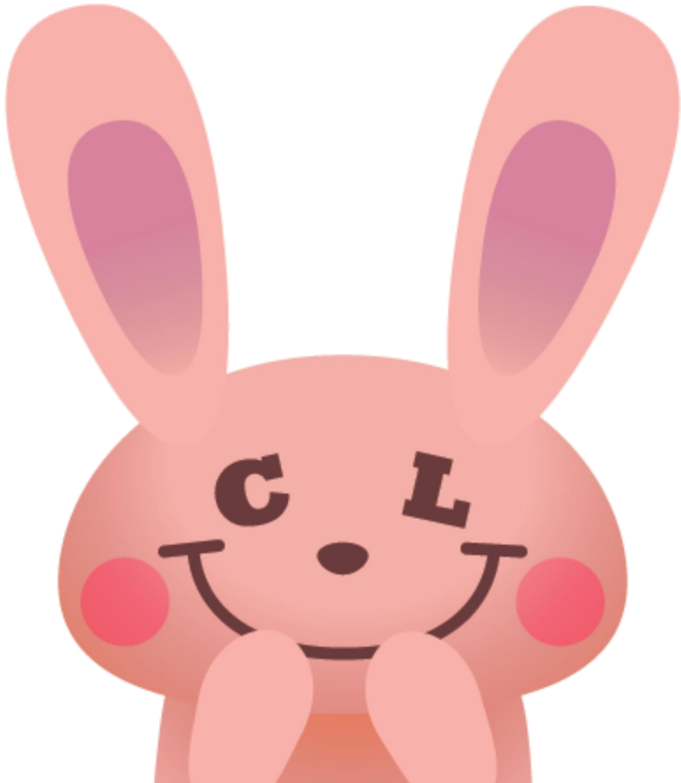
中リーマスコットキャラクター「CL うさぎ」