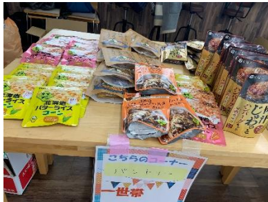
(フードパントリーの食品)