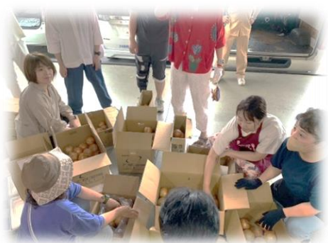
(こども食堂食材配布)