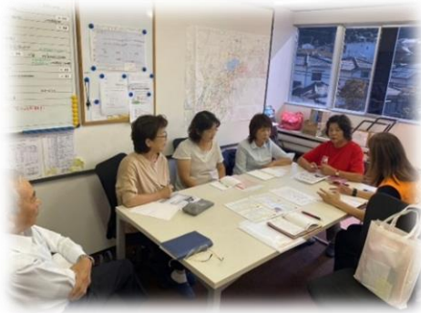
(こども食堂再開にむけた地域メンバーへの説明)