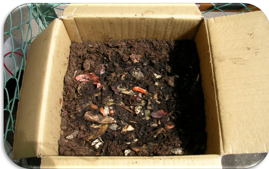
ダンボールコンポスト