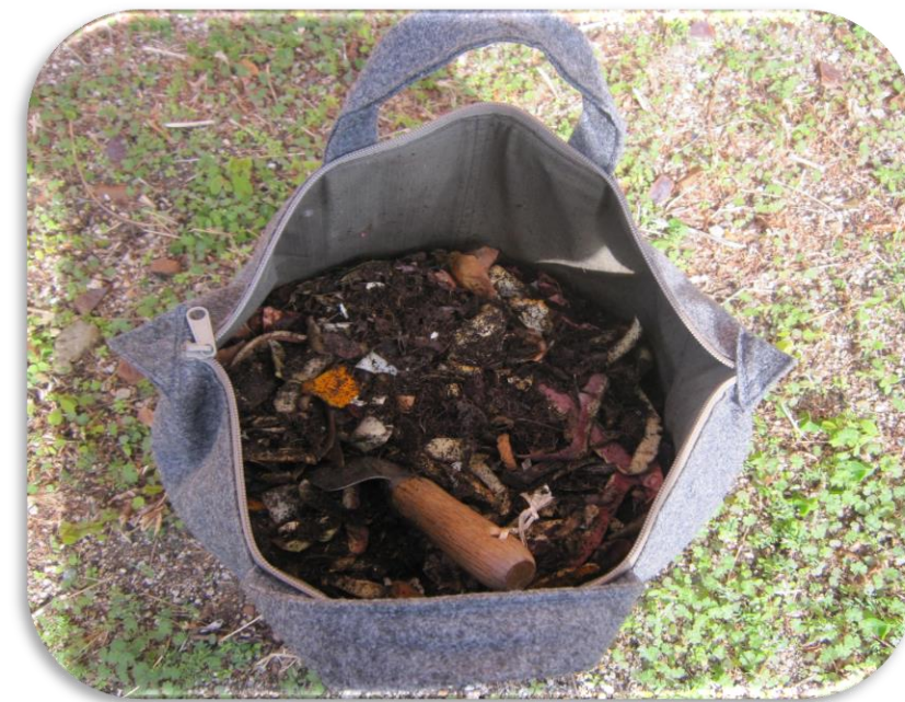
バッグ型コンポスト