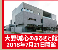
大野城心のふるさと館 2018年7月21日開館

7ルートの見どころをより詳しく紹介したマップを大野城心のふるさと館内やホームページで見ることができるよ。