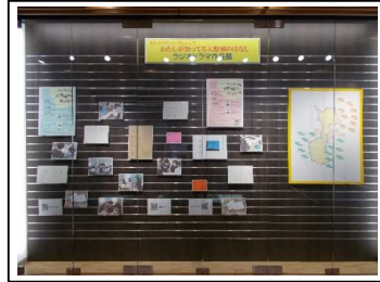
〈心のふるさと館でのラジオドラマ作品展の様子〉