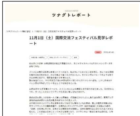
〈ツナグサイト上のレポートページ〉