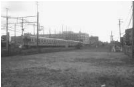
連続立体交差事業 仮線予定地

JR鹿児島本線のアンダーパス部分を含めた下大利工区の工事を行っています。完成後は、交通量が増大すると予測されますので、信号機の設置や歩道整備等を行い、車と人の安全な交通体系を作るようにしています。西鉄バス路線は、下大利南ヶ丘線のアンダーパス開通後、交通状況を見て判断するとの回答を西鉄から、得ています。地域の方の安全対策と早期の竣工等は、県に要望するとともに、市も検討していきたいと思えます。