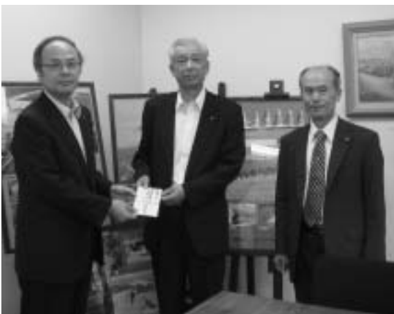
宮崎県福岡事務所にて

大野城市議会は宮崎県内で発生している口蹄疫被害に対して、市及び市民と一緒に支援することを決議しました。