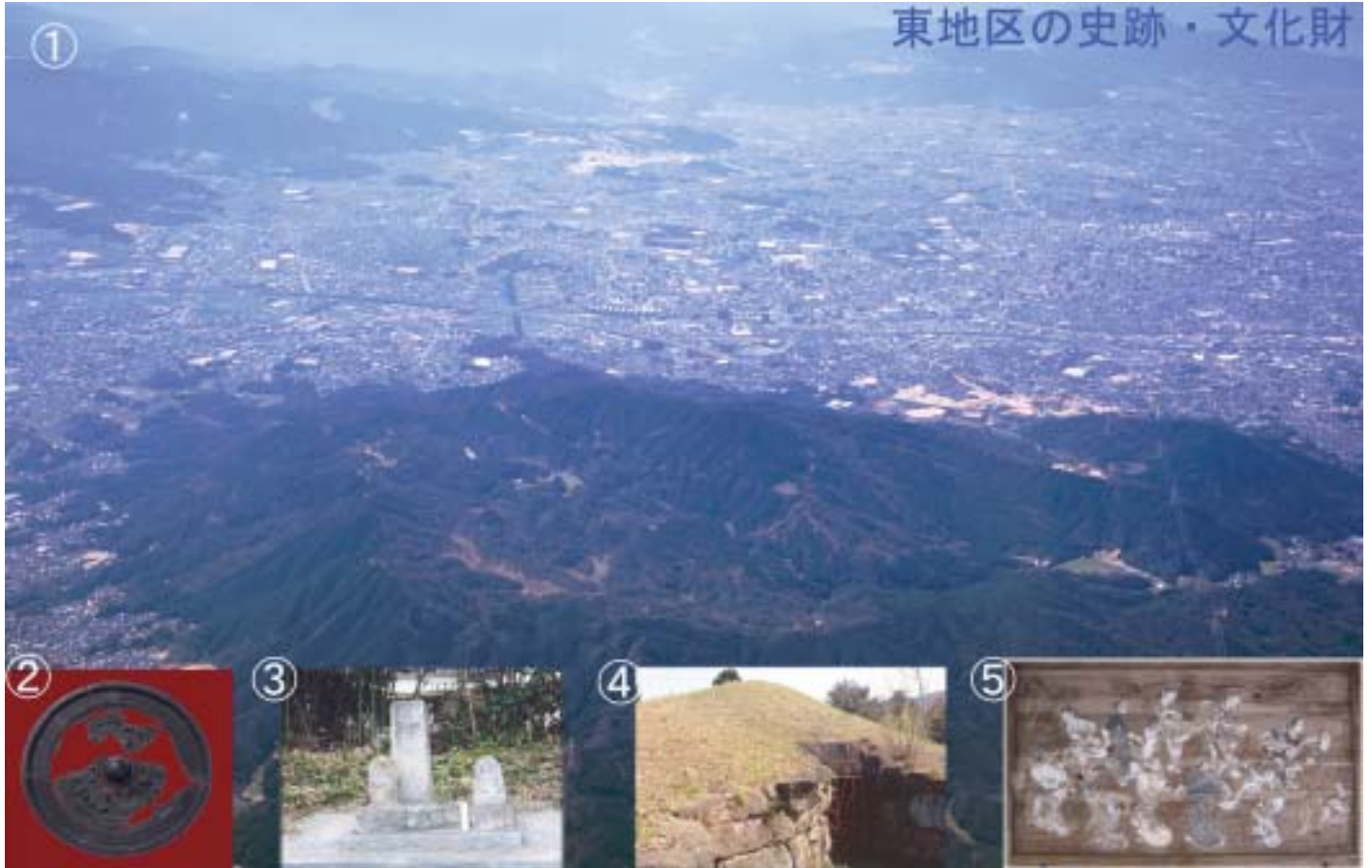
① 四王寺山と大野城跡