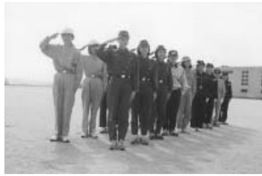
他地域で活躍する女性消防団員

大野城市消防団活性化検討委員会は、現職の消防団員幹部・元消防団長、各コミュニティから推薦を受けた区長、春日・大野城・那珂川消防署長の計15名で構成され、検討課題として人員確保・分団管轄区域と配置人員の見直し、消防団の消防力の強化、消防活動の充実などが協議されました。この検討委員会の提言で、消防団員の確保策の一つとして女性消防団員の採用が挙がっており、今後、消防団活性化計画を策定する中で十分検討していきます。 消防団業務は消火・警防活動・防火指導や予防啓発と多様化しており、幅広い人材が求められ