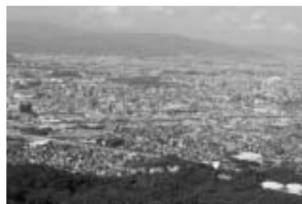
四王寺山から望む大野城市

具体的には、サミットを通してつくり上げられた山城を持つ自治体のネットワークを活用し、