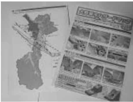
大野城市ハザード（防災）マップ

制度の見直しは、動き出したばかりなので、意見があれば、より実効性のある制度となるよう検討していきます。登録された情報の更新は個々の情報提供により速やかに行っていきます。要援護者に対応したハザードマップの作成も、今後進めていきます。