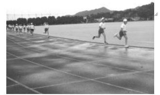
全天候型のグラウンドを疾走