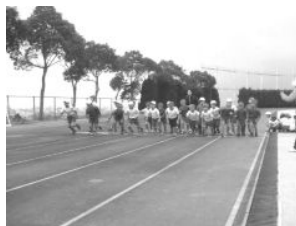
スタート直前緊張感一杯

19年12月11日 大野城総合運動公園 多目的グラウンド 自分のペースで、最後まで