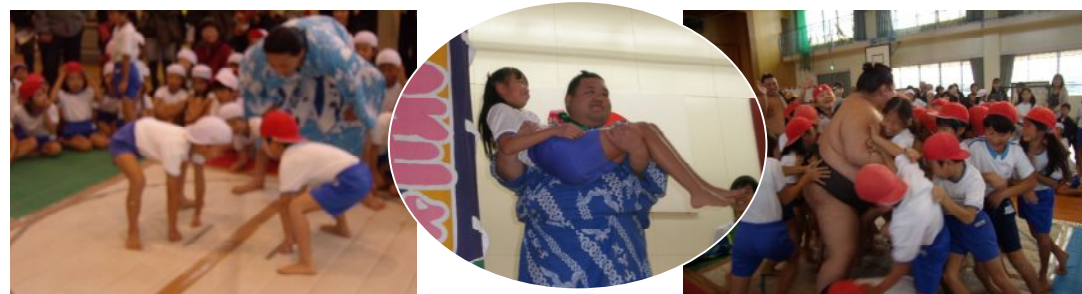
はっけよい お姫様だっこしてください みんなでヨイショ