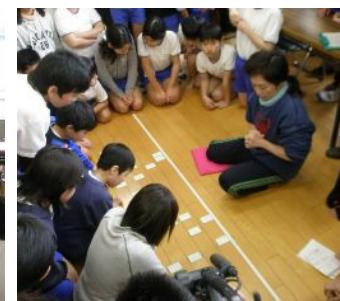
【山口名人との4対1の対戦】