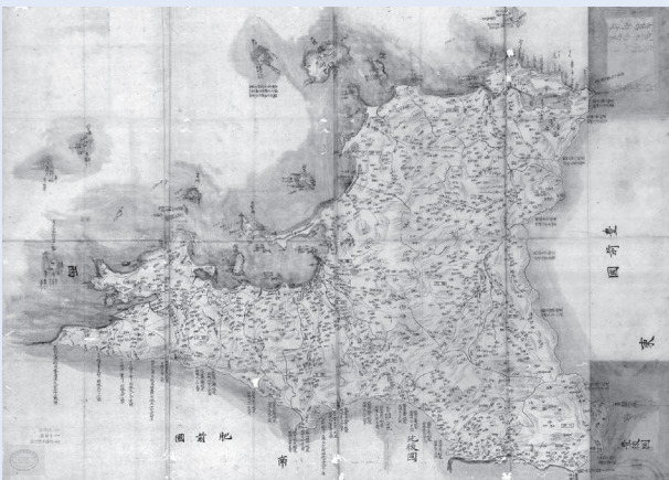
ぶんげん 「筑前国分間絵図」日下田定鷹筆 江戸時代 九州歴史資料館所蔵