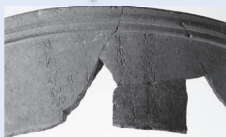
ハセムシ窯跡群12地区ヘラ書き須恵器