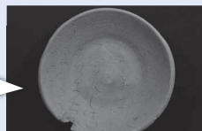
ケカチ遺跡 和歌刻書土器