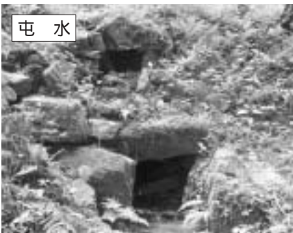
「大野城」の排水施設の水門

プレサミット事業では、「大野城の響き」や「大野城の舞」の演舞コンテストの開催や、関係自治体首長会議、記念講演などを行います。