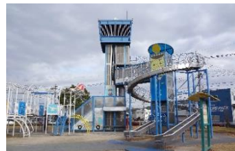
仲畑中央公園(仲畑)