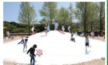
大野城いこいの森 中央公園(牛頸)