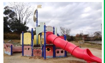
三兼池公園(上大利)